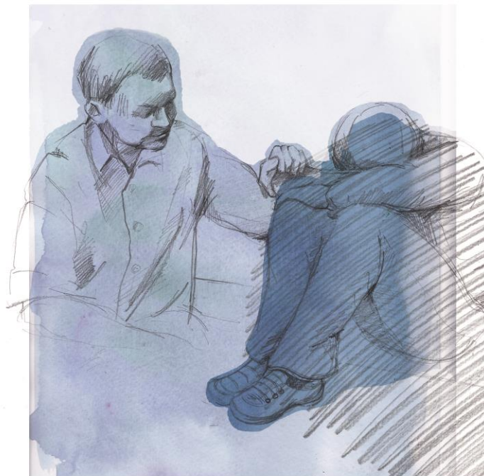
Illustratör: Catrina Norman Tengroth

Kommunikationen är det viktiga – den kan ske på många olika sätt, också ordlöst