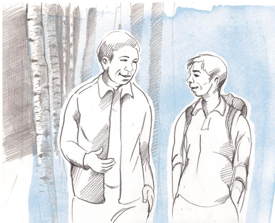
Illustration: Catrina Norman Tengroth

Materialet hittar du från och med sommaren på www.begripligt.nu